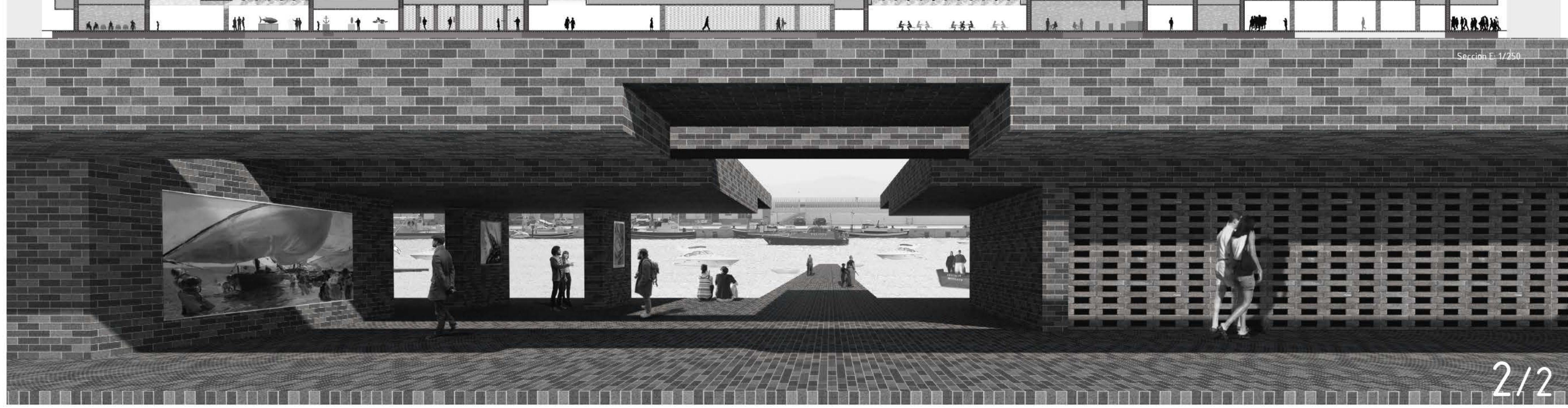
Sección E: 1/250