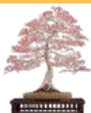
CONCURSO DE PROYECTOS

Curso académico 2020/2021 PROGRAMA DE ACTIVIDADES