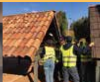
VISITAS A FÁBRICA

Hispalyt se relaciona con el ámbito de la enseñanza de la arquitectura a través del Foro Universitario Cerámico Hispalyt , cuyo objetivo es que los futuros arquitectos tengan un mayor conocimiento de las prestaciones técnicas y de las enormes posibilidades de los materiales cerámicos en general y del ladrillo en particular.