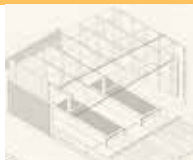
PREMIO TFM Y TFG