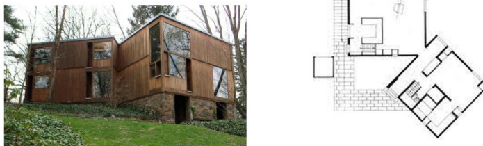
Casa Fisher, Louis Khan